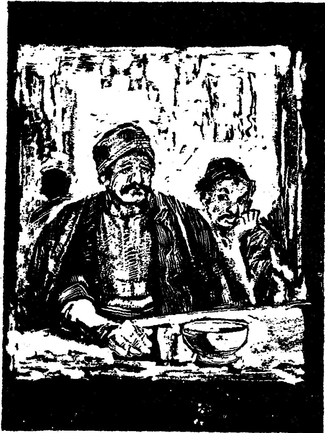
فتظاھر عبد ربہ بالرجولۃ وقال : نالت جزاءھا